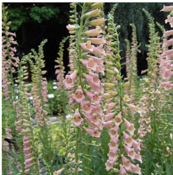
Digitalis 'Glory of Roundway'