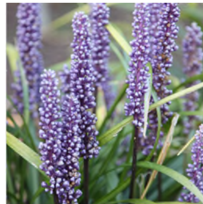
Liriope muscari 'Bigblue'