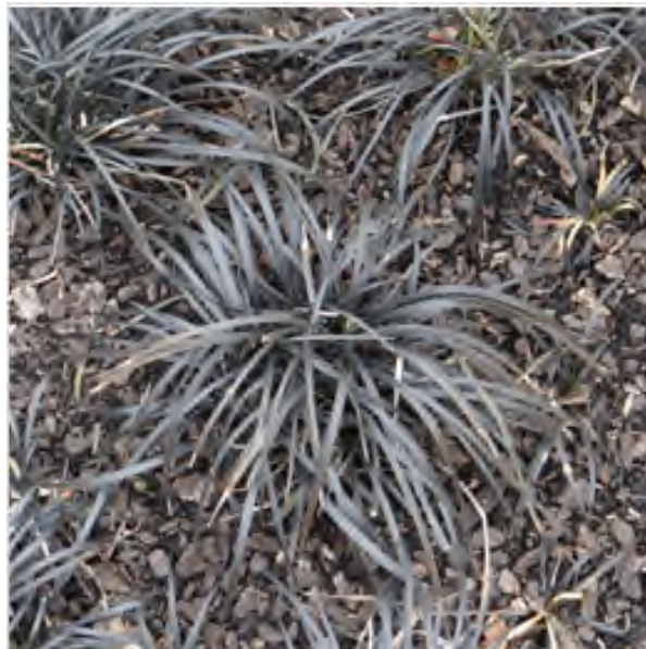
Ophiogon planiscapus 'Niger'