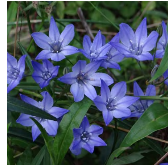
"Triteleia laxa 'Koningin Fabiola'"