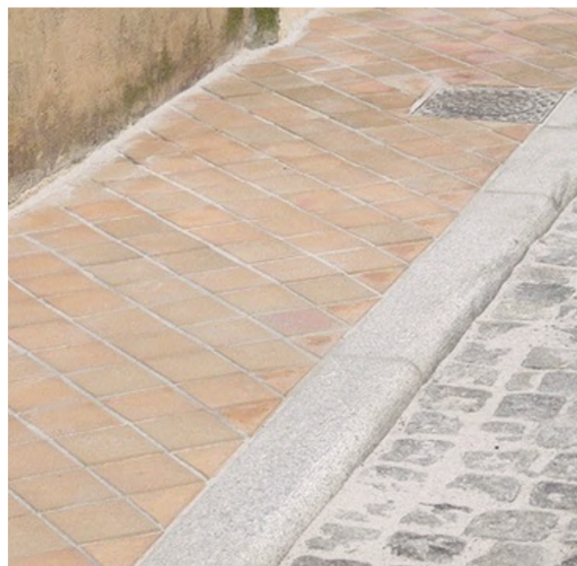
Cale bordelaise (pavés en terre cuite)