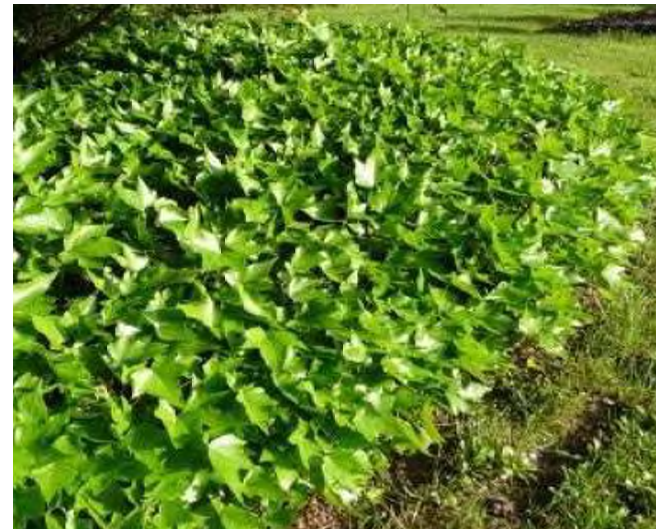
Hedera helix 'Green Ripple' byzantina