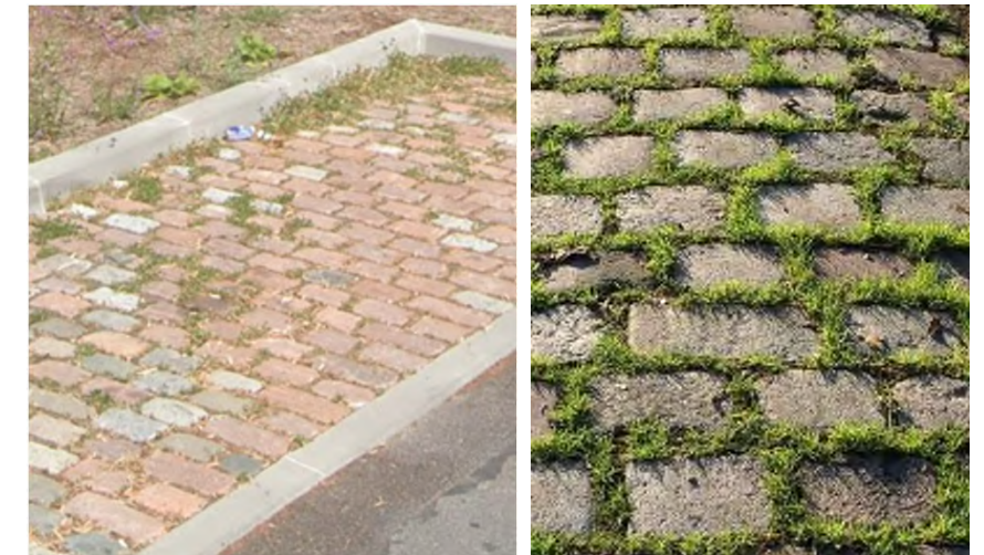
Pavés de récupération 13x20cm en granit Zones exclusivement piétonnes - Joints enherbés