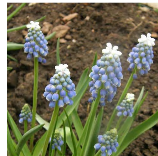
Muscari armeniaceum 'Valerie Finnis'