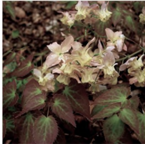
Epimedium versicolor 'Cupreum'