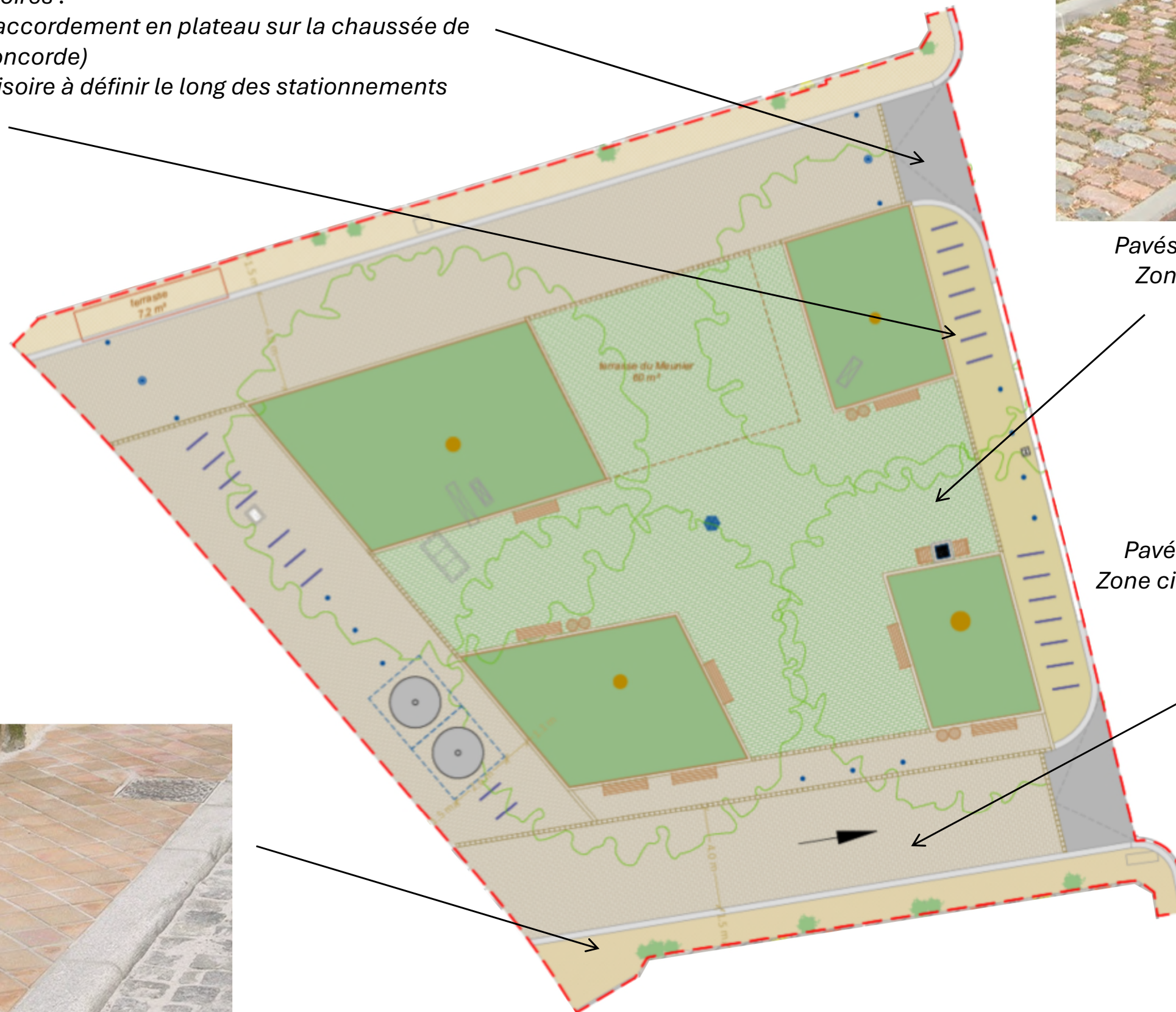
Pavés de récupération 13x20cm en granit Zone circulaire (SDIS33, VL) - Joints mortier