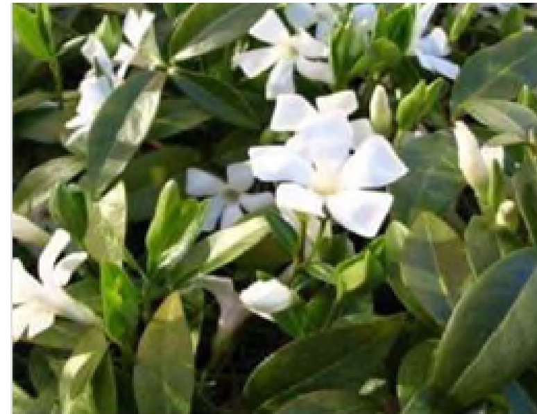
Vinca minor 'Gertrude Jekyll'