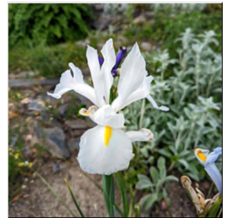
Iris hollandica 'White Magic'