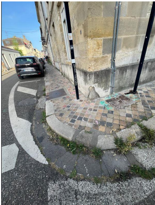
Intersection pas aux normes