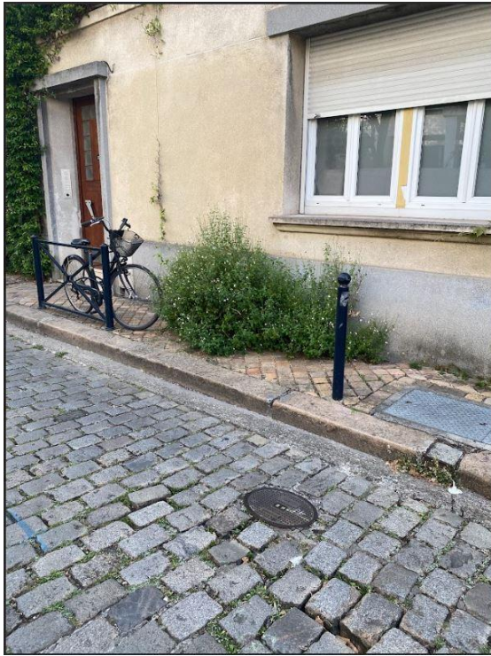
Statio. vélo et végétation sur le trottoir