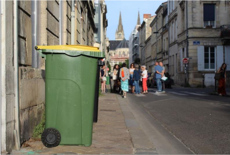
Poubelles laissées sur le trottoir empêchant la circulation des piétons